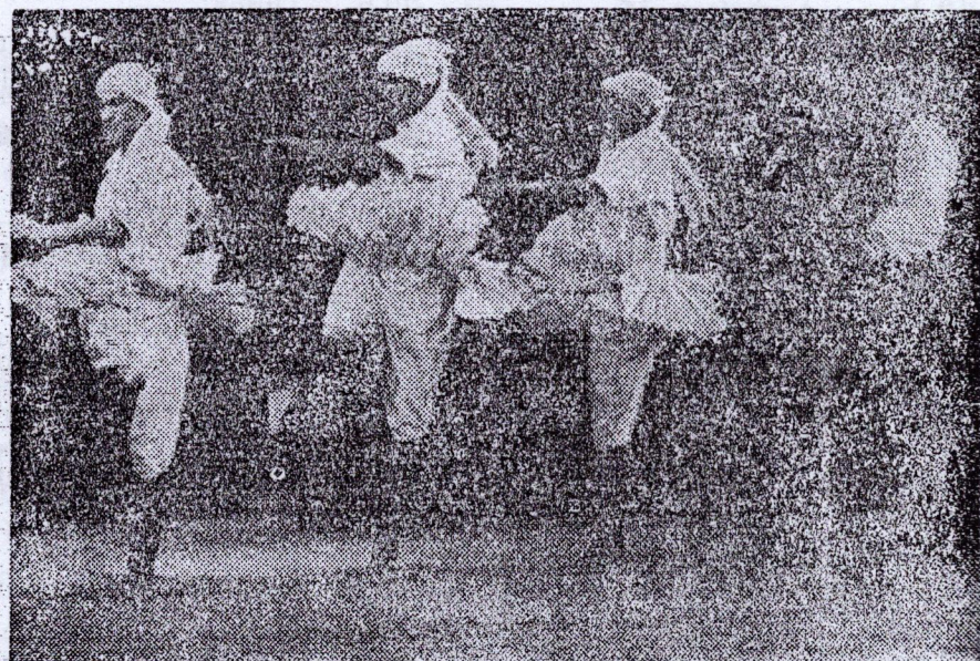
Le public de Conakry a eu l'occasion d'applaudir les artistes yougoslaves lors de leur production au «Palais du Peuple». Notre photo: Une danse populaire exécutée par les artistes.